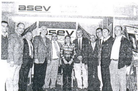
Stand de la asociación de empresarios de Villamartín en la Feria de Muestras. RAMÓN AGUILAR

Por eso la Confederación Empresarial de la provincia de Cádiz (CEC), en colaboración con la asociación de empresarios de Villamartín y la de Ubrique, ha llevado hasta la localidad el seminario La importancia del entorno urbano y la accesibilidad y movilidad para el Centro Comercial Abierto: resumen y conclusiones , con el que anoche reunió a comerciantes de la zona para analizar las fortalezas y debilidades de este sector.