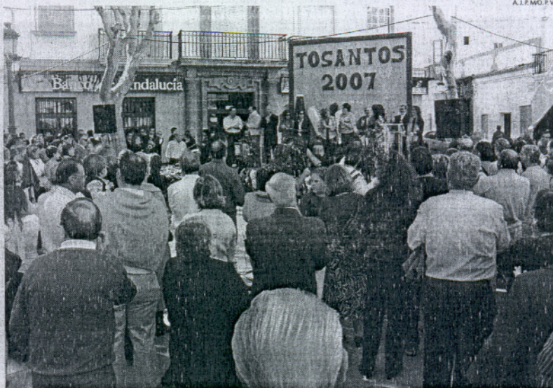
Éste es el aspecto que ofrecía en la mañana de ayer la Plaza de España, donde se ubica este mercadillo.