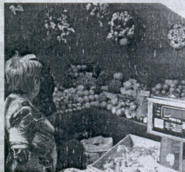
Las frutas también tienen su espacio en Tosantos.