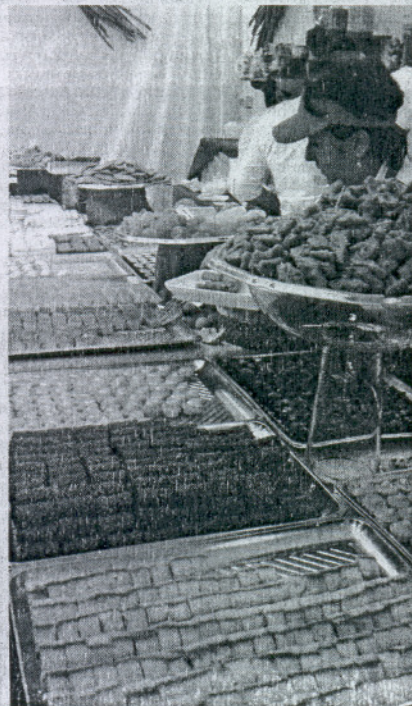
Los pastelillos, uno de los principales atractivos.