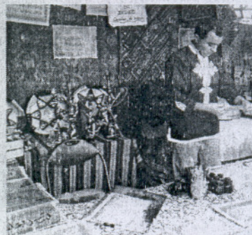
Una de las novedades: la caligrafía árabe.

ranos en participación, y otros se han sumado este año.