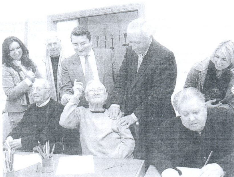
Javier Arenas y Antonio Sanz, del PP, durante su visita al centro de día Cristina Boda, en Rota.

El presidente de los 'populares' en Andalucía, Javier Arenas, hace campaña en Rota y critica ante colectivos afectados el bajo nivel de ejecución de la normativa