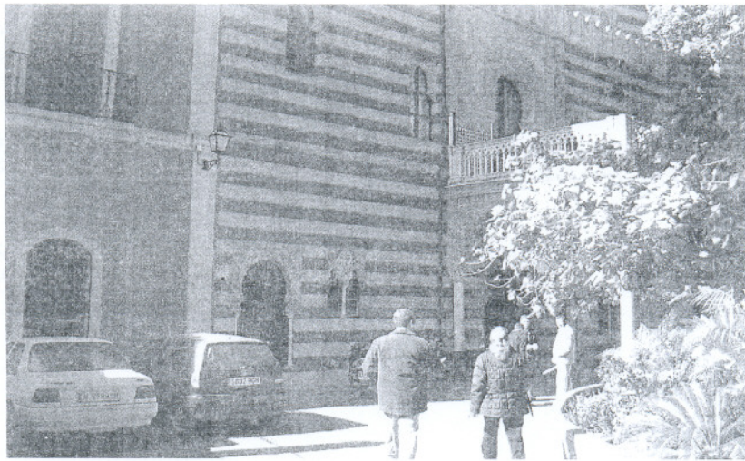
AYUNTAMIENTO. Las deudas del anterior equipo de Gobierno dejaron al Consistorio en crisis.

Por otra parte, el delegado de Economía anunció que el contrato de auditoría se adjudicará siguiendo lo previsto en la Ley de Contratos de las Administraciones Públicas, «mediante la forma de