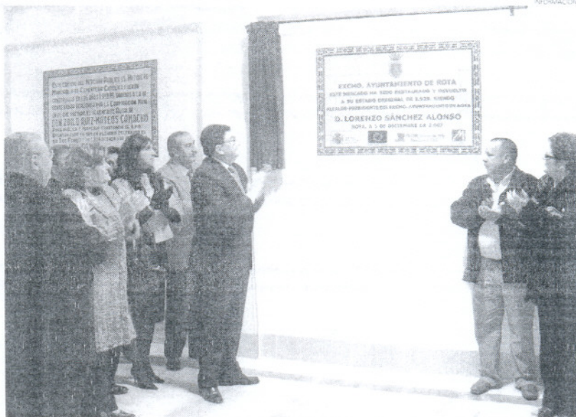
Descubrimiento de la placa que recordará la remodelación de este mercado, que fue un convento mercedario.

Posteriormente, el alcalde descubría una placa conmemorativa en la que se recoge la fecha de inauguración del mercado tras sus obras de rehabilitación que lo han devuelto a su esplendor original, destacando la recuperación del magnífico patio, que se había perdido. En su intervención, el alcalde destacó la rehabilitación del casco histórico como uno de los aspectos más importantes con los que se han enfrentado y en los que ha venido trabajando en los últimos cuatro años el equipo de Go-