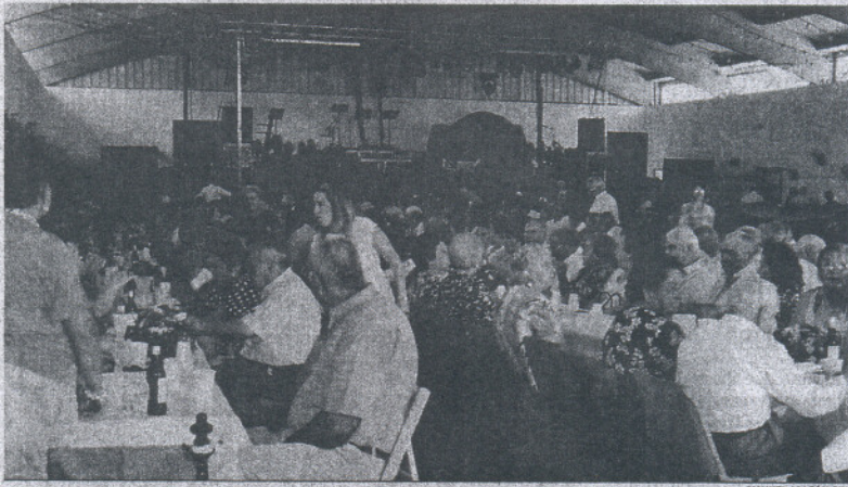
Imagen de la comida organizada para los mayores de Paterna durante la semana de Feria.

■ PATERNA. La Feria se despidió ayer de los paterneros tras cinco días de diversión y un sano ambiente popular. Miles de vecinos y turistas han recorrido durante la semana el recinto ferial, que ha tenido como focos de atención el ambiente de las cinco casetas instaladas, la diversión del amplio parque de atracciones y de las actuaciones musicales y, de nuevo, los encierros callejeros, únicos en Andalucía en estas fechas y cada año más atractivos para los visitantes.