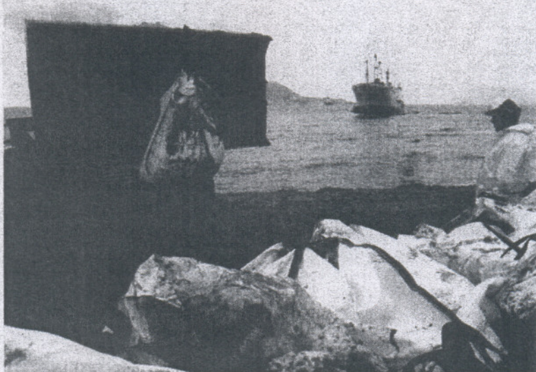
El 'Sierra Nava' encalló en la Bahía de Algeciras el 28 de enero y motivó la recogida de 2.900 toneladas de arena y lodo.

"El trabajo coordinado entre la Junta de Andalucía, y los minis-