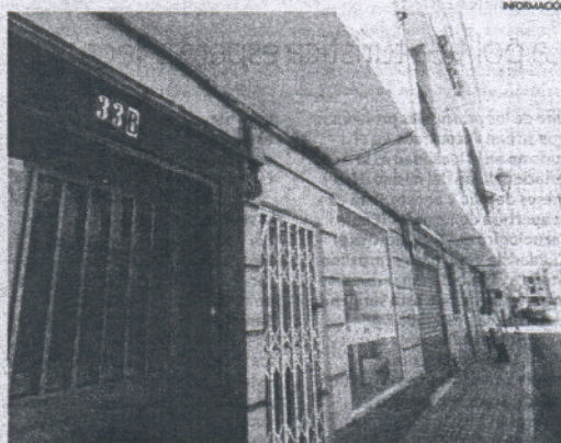
El incendio se produjo en un inmueble de cuatro plantas en la calle Aurora.

Hasta el lugar de los hechos, se trasladaron la Policía Nacional y los bomberos. Así, mientras que, por seguridad, los agentes desalojaron el inmueble, el cuerpo de bomberos procedía a la extinción del incendio de la vivienda, donde, según los vecinos, residía "un matrimonio, mayor".