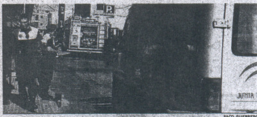
Imagen del operativo desplegado durante el incendio.

personales, provocó la alarma entre los residentes, vecinos de la zona y personas que transitaban por la calle Aurora de la localidad.