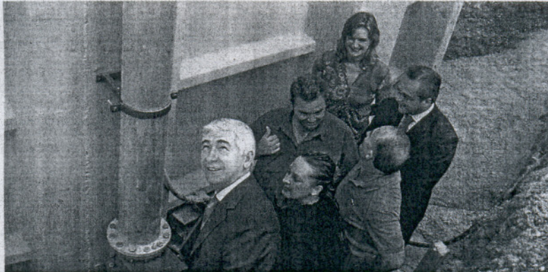
FUNCIONAMIENTO. Los responsables políticos pusieron en marcha en septiembre un nuevo sondeo

El Ayuntamiento serrano ha mostrado su intención de abrir un expediente que pretende que se aclaren las causas que han provocado esta avería. Al mismo tiempo eluden toda responsabilidad recordando que el suministro no corresponde al Consistorio