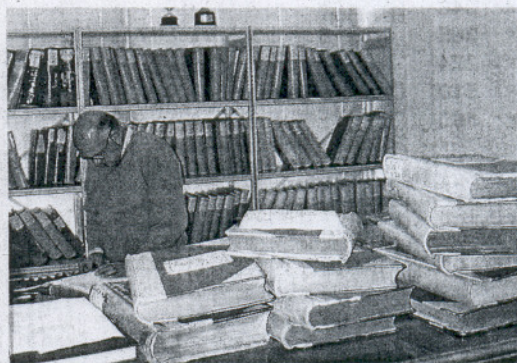
ACTIVIDAD. Libros de altas en el registro de El Puerto. / I. B.

La apertura de los registros se debe a un plan que presentó Con-