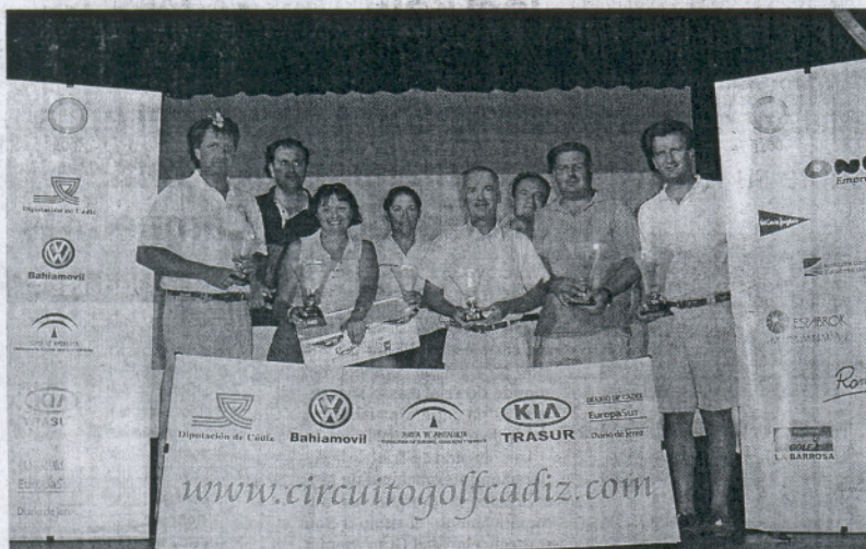
Los ganadores de la penúltima prueba comparten protagonismo con sus trofeos.