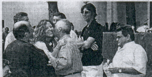
SALUDOS. Los escritores, a su llegada al claustro.

elegido dar cabida a aquellos temas que tienen que ver con los deseos, los problemas y las esperanzas de las personas, los llamados sociales que nada tienen que ver con la alta política y la economía, los que reflejan pensamientos de la gente», apuntó el autor de Mala gente que camina (2006) creador de un alter ego, Jutan Urbano, que une ficción y realidad en sus columnas.