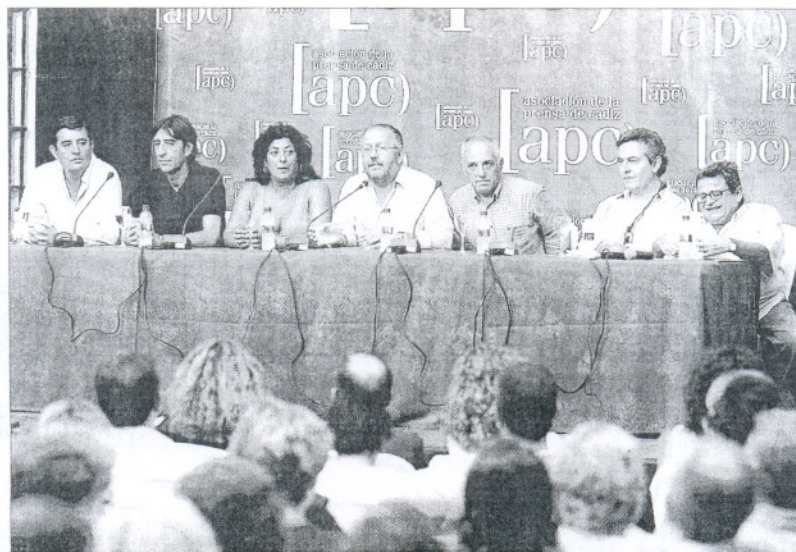
Participantes en el coloquio celebrado ayer en la Asociación de la Prensa de Cádiz.