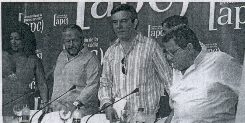
CONCURRIDA. Algunos de los miembros de la mesa se acomodan al llegar al convento.

«El periodismo se está convirtiendo en una de las razones por las que un periódico cobra cierto sentido en un contexto dominado por la saturación informativa y la publicidad», aseguró Benjamín Prado para quien cada vez más la opinión se presta a buscar «lugares inéditos» ajenos al discurso general sobre lo real. «Como columnista he