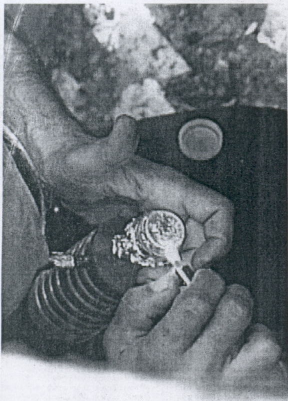
de plata tras un muro en una zona deshabitada.

Un incendio en la cocina de un piso obliga al desalojo de medio centenar de vecinos del centro