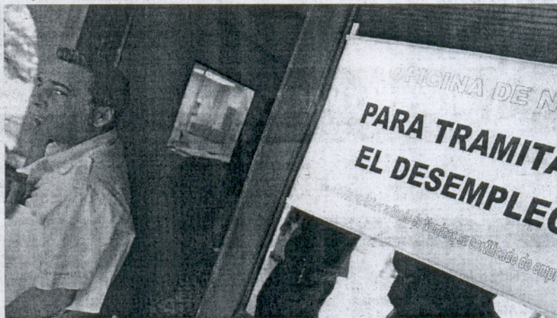
PROCESO. Comenzó el viernes 10 de agosto una vez que se prepararon los finiquitos.

En septiembre se negociarán la formación y recolocaciones