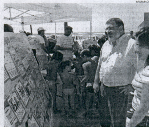
El delegado de Pesca visitó esta campaña de la Junta de Andalucía.

La campaña de concienciación No rompas el equilibrio. A cada pez su talla , se articula a través de juegos y talleres que coordinan diversos monitores. De este modo, los ciudadanos que se acercaban a esta campaña pudieron participar en juegos como el del ciclo del pez, que tiene como objetivo dar a conocer a los ciudadanos la importancia que tiene el hecho de que un pez alcance su talla mínima, así como todos sus ciclo de vida; o la fábrica de mensaje, a través de la cual los participantes construyen un libro gigante en el que exponen con dibujos y relatos su interpretación sobre las problemas que conllevan la captura y el consumo