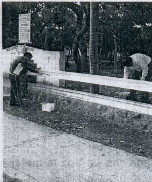
Dos operarios trabajan en el Pinar de la Almadraba.

Por todo ello, Ecologistas en Acción ha remitido un escrito a