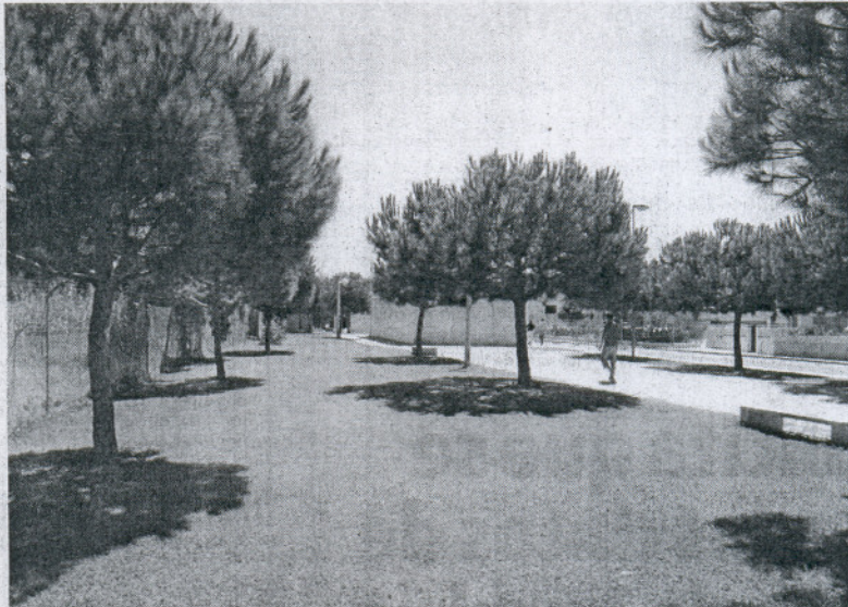
Este espacio estaría integrado en el parque Carlos Cano, en la avenida Crucero Baleares.

A la hora de ubicar este parque para perros en Crucero Baleares, se ha estudiado que la zona elegida no merme en ningún caso el espacio reservado a juegos o a paseo de los usuarios de esta zona, ya que por las dimensiones del parque Crucero Baleares, hay posi-