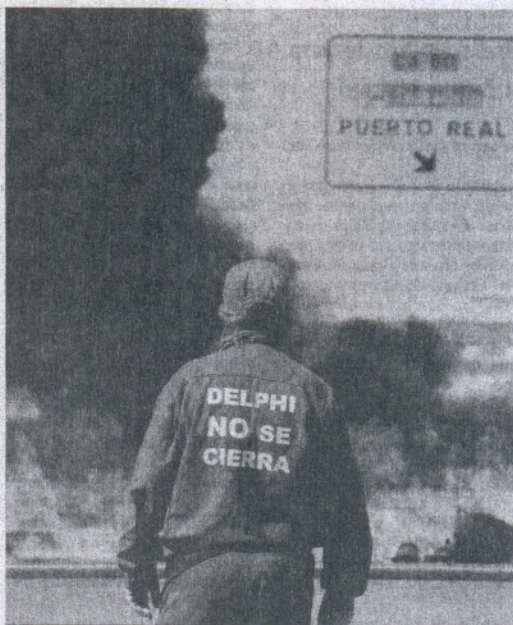
Las movilizaciones pueden volver de la mano de los operarios de contratas.