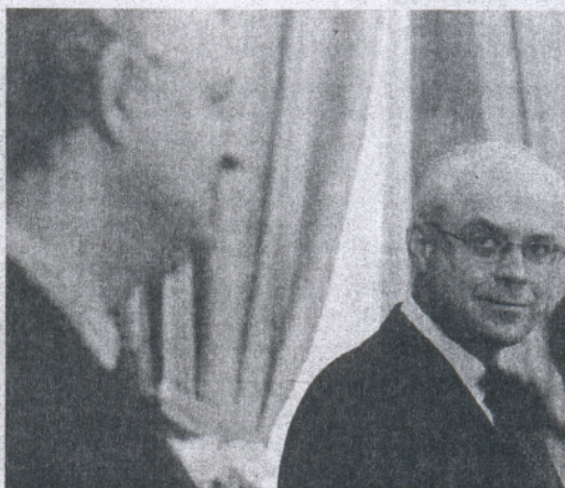
Caldera y Spidla, ayer en la rueda de prensa. JOSÉ RAMÓN LADRA

comisario de Empleo condenó la ruptura del alto el fuego por parte de ETA, y se refirió también al buen uso que hace el Gobierno español del dinero que recibe del Fondo Social Europeo.