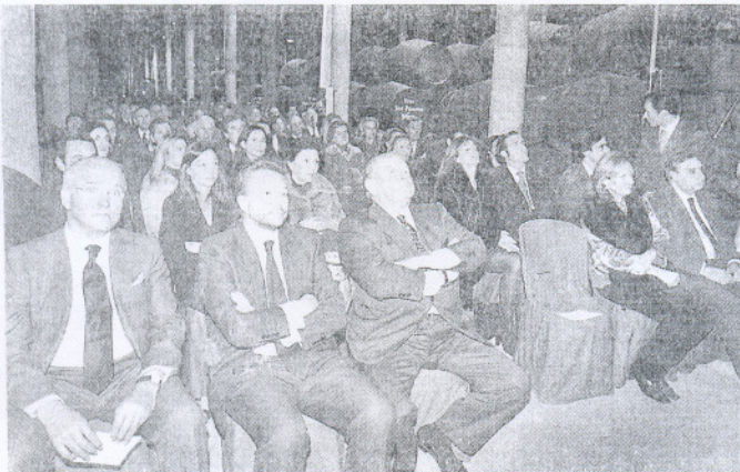
Aspecto que presentaba anoche la impresionante bodega San Patricio, donde se celebró el acto de entrega de los premios Conde de Garvey. En primer plano, los tres galardonados.