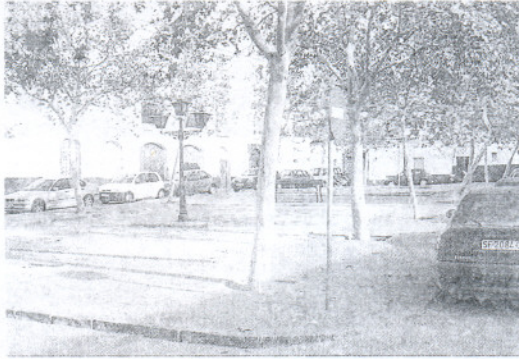
La plaza Manuel Romero Pazos, ubicación planteada para un parking.