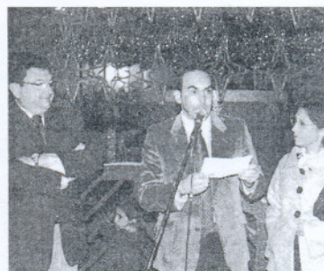
El alcalde y el delegado de Fiestas, en la inauguración.