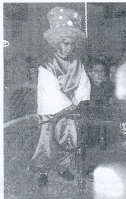
Este niño fue el encargado de encender el alumbrado.