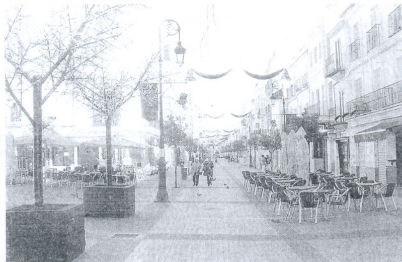
El alumbrado navideño lucirá a partir del sábado que viene.