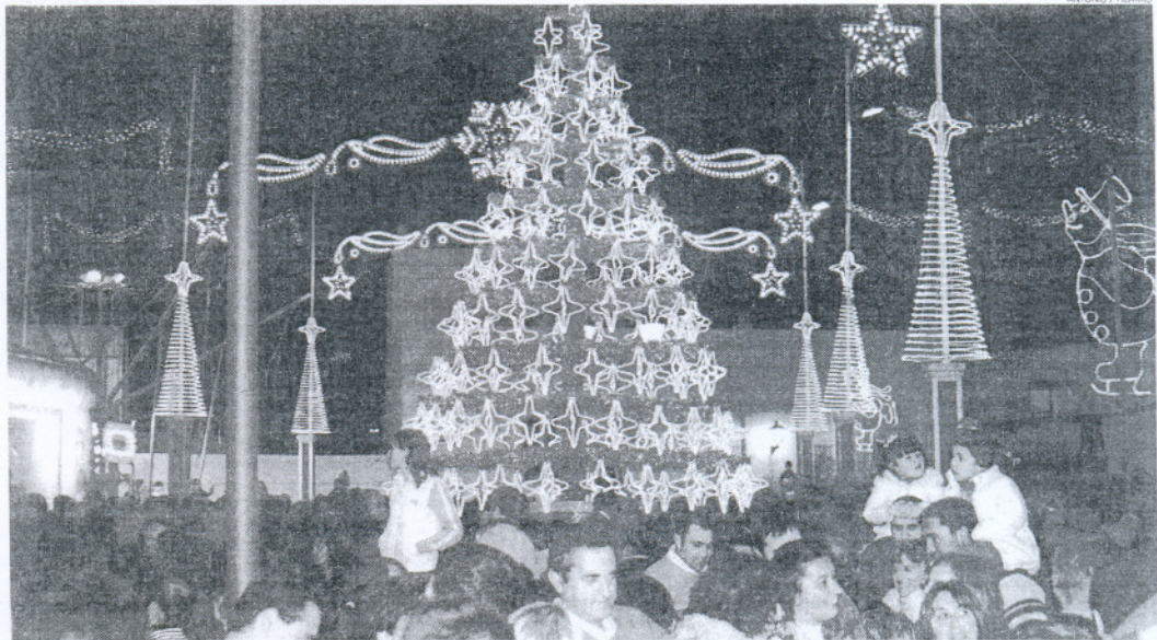
Miles de personas disfrutaron de la Plaza de la Navidad el día de su inauguración.

Desde ese momento los niños se convirtieron en protagonistas absolutos de la noche en un marco en el que todo estaba diseñado para hacerlos felices. Un gigantesco árbol de Navidad iluminaba una novedosa pista sintética de patinaje (de 200 metros cuadrados) en la que rápidamente los más pequeños, debidamente equipados con sus patines, comenzaron a disfrutarla, conociendo más de uno en pocos minutos la dureza de esa superficie ya que no eran infrecuentes las caídas. Justo al lado, una gigantesca cama elástica veía como los niños se lo pasaban a lo grande saltando y dando volteretas mientras los demás esperaban pacientemente su turno. Enfrente una gran pantalla de cine congregaba a muchos pequeños que no se perdían ni un