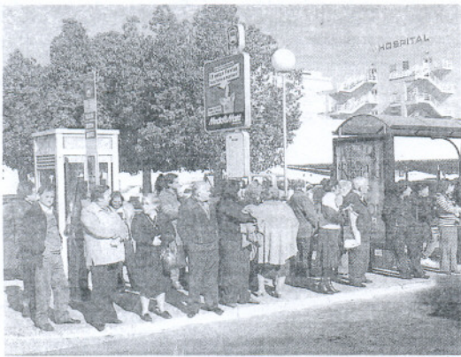
Afectados por los paros en la parada del hospital de Puerto Real. JAVIER GONZÁLEZ

Representantes sindicales y de la empresa se reunirán hoy para tratar de alcanzar un acuerdo que acabe con la protesta