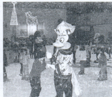
Mickey Mouse, en la pista de patinaje.

detalle de la película infantil que estaba siendo proyectada.