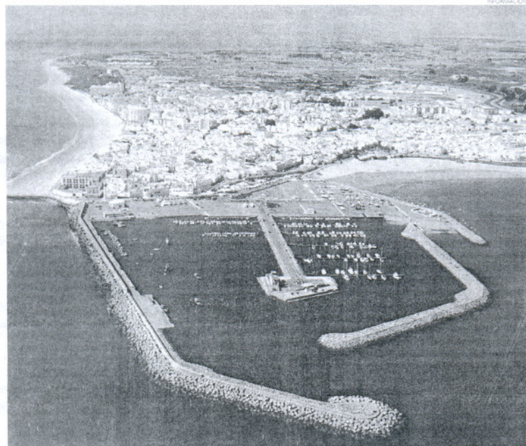
La mayor parte de las viviendas afectadas por los planes de Costas pertenecen al municipio de Rota.